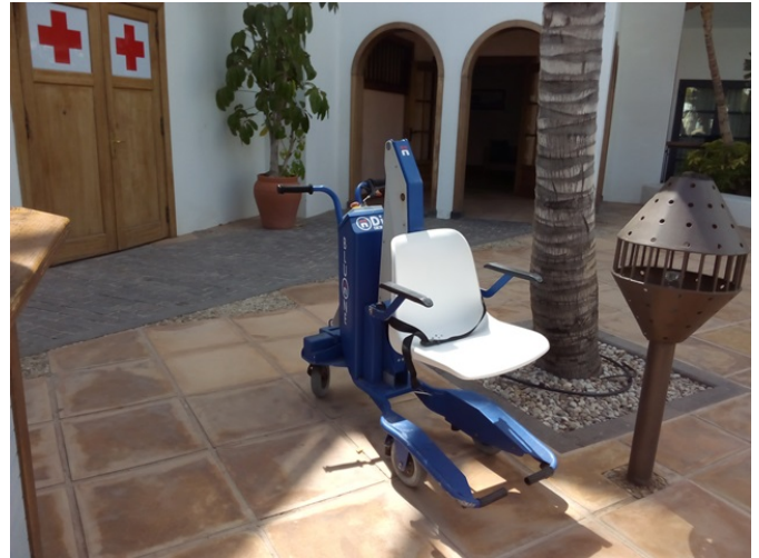
Grúa móvil para acceso a piscinas