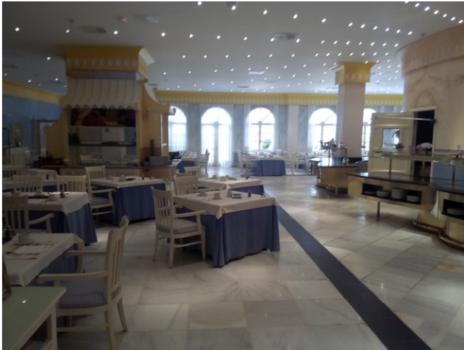
Salón comedor "Restaurante Yaiza"