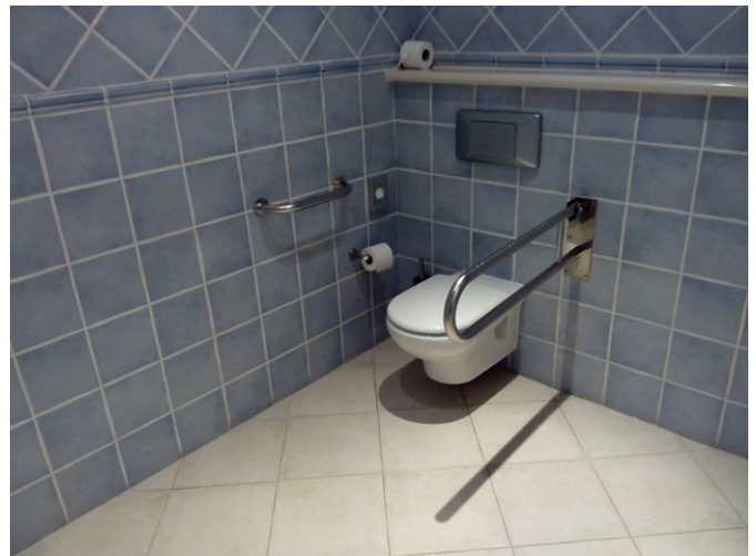
Aseo de la habitación adaptada